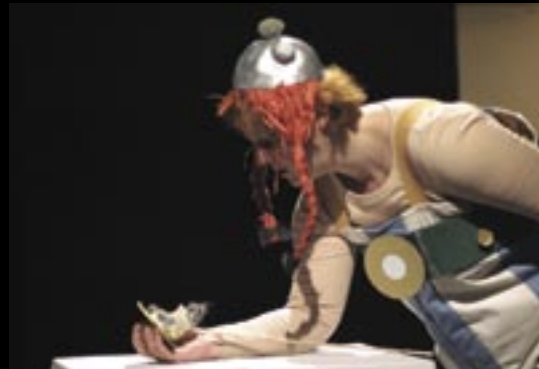
„Auf nach La Mancha!“